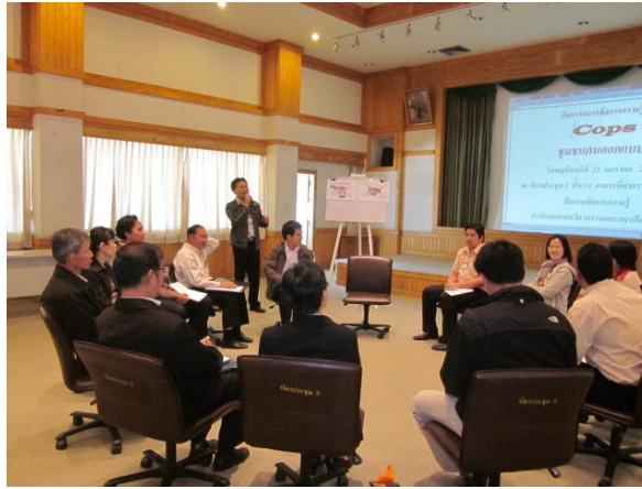
หัวหน้าทีมงานกิจกรรม CoPs เปิดกิจกรรม