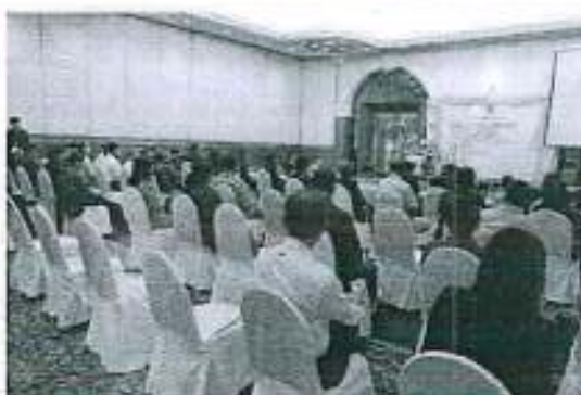
ตัวแทนทีมชลประทานท้องถิ่นนำเสนอแผนพัฒนาสู่ม้าคลองกลายแบบมีส่วนร่วม