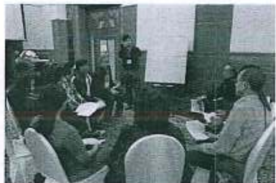
การแบ่งกลุ่มย่อยแต่ละตำบลเพื่อจัดลำดับความสำคัญของแผนพัฒนาแหล่งน้ำ