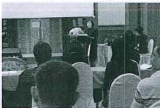
กรมชลประทานให้ข้อเสนอแนะการขับเคลื่อนแผน และมอบนโยบายด้านความมั่นคงด้านน้ำของประเทศ