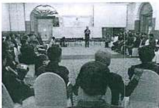
การถอดบทเรียนการดำเนินงานชลประทานท้องถิ่นตลอดระยะเวลา ๓ ปี