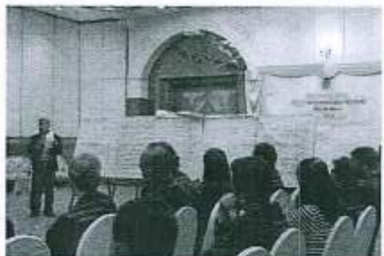
การจัดลำดับความสำคัญของแผนพัฒนาลุ่มน้ำคลองกลายแบบมีส่วนร่วม