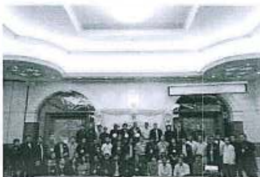
พิธีมอบโล่ประกาศเกียรติคุณ