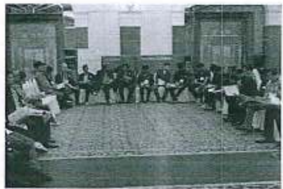
การชี้แจงวัตถุประสงค์การจัดสัมมนา